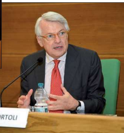
Ferruccio De Bortoli

ambito europeo l'Italia è il terzo mercato per l'impiego di prodotti chimici". Il presidente di Confcommercio Carlo Sangalli ha ricordato l'emergenza ancora aperta per un terziario di mercato che, nel 2020, si è misurato con una caduta dei consumi di 107 miliardi di euro. La ripartenza, ha detto, è un percorso con tante tappe. E se la prima tappa sono i sostegni, per arrivare in cima occorrono politiche, progetti e investimenti.